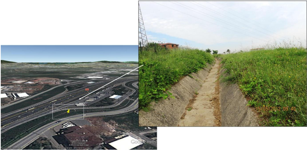
Şekil 4. İstanbul'daki yeni lokasyonun yeri