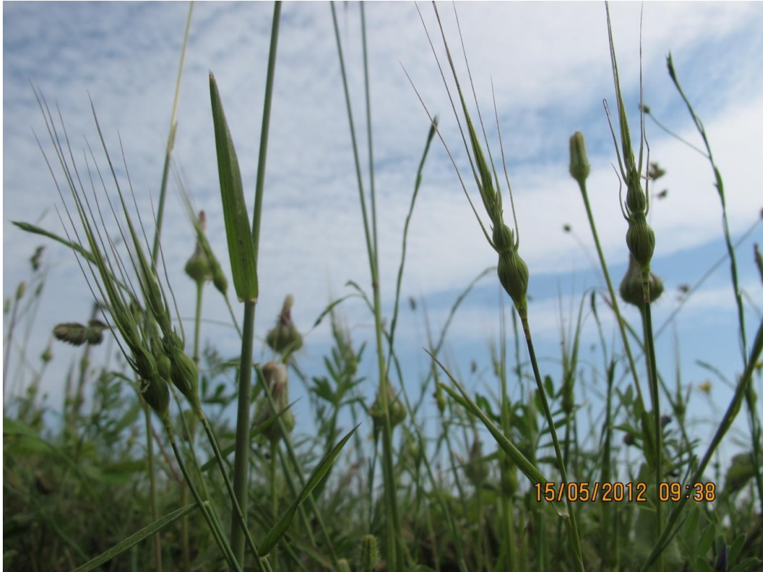
řekil 3. İstanbul'daki yeni alanda Tekkılık ( Ae. uniaristata ) türü