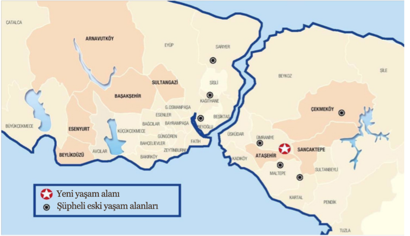
řekil 2. Tekkılık ( Ae. uniaristata ) türünün İstanbul ilindeki eski ve yeni lokalite kayıtları